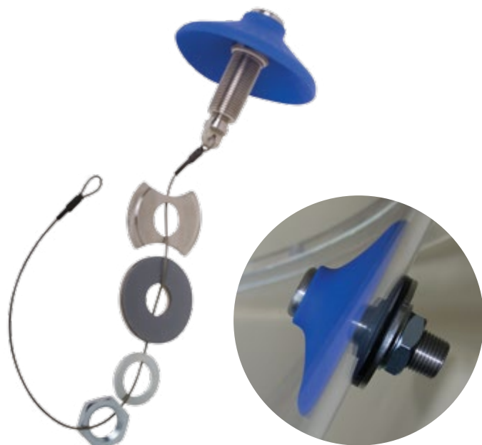
套件的组件 与安装工具一同显示。 (Install Tool)。